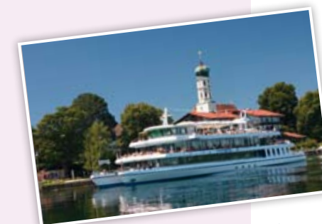
Ein schöner Platz zum Leben und Wohlfühlen