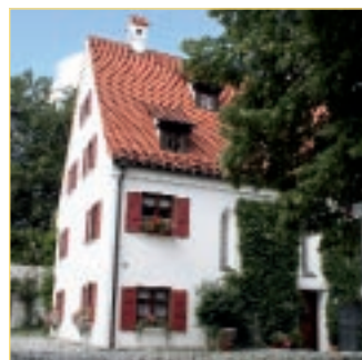
Die Stiftung der Herren von Güssen begründete die Stadt Leipheim an der Donau 1315 mit einem Hospital.