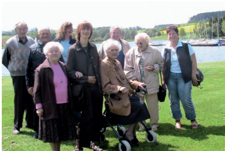
Ausflug der Diakoniestation mit Ihren Kunden

» Der Mensch mit Leib und Seele ist für uns das Maß aller Dinge «